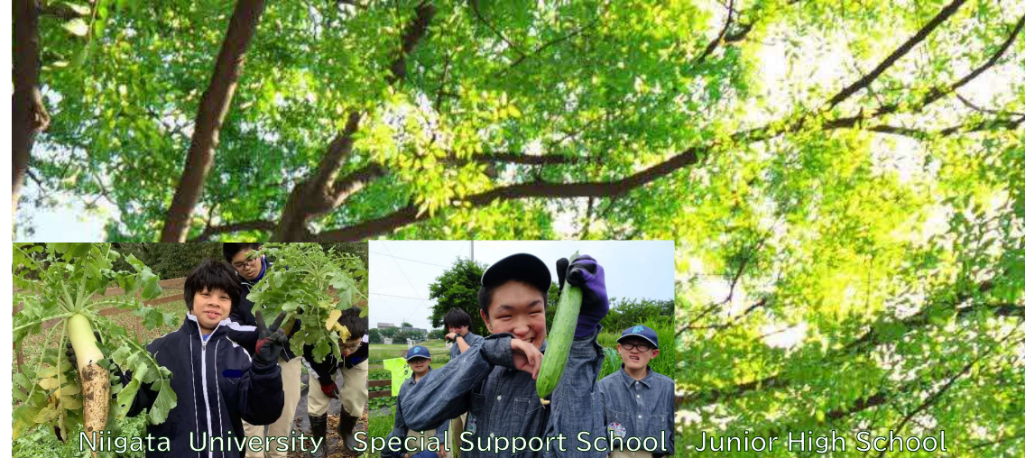
Niigata University Special Support School Junior High School