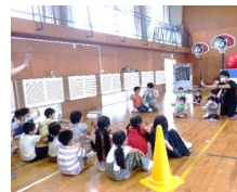
▲ 附属新潟小との交流会