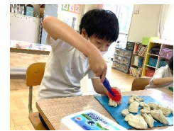
▲ 粘土を使った造形遊び